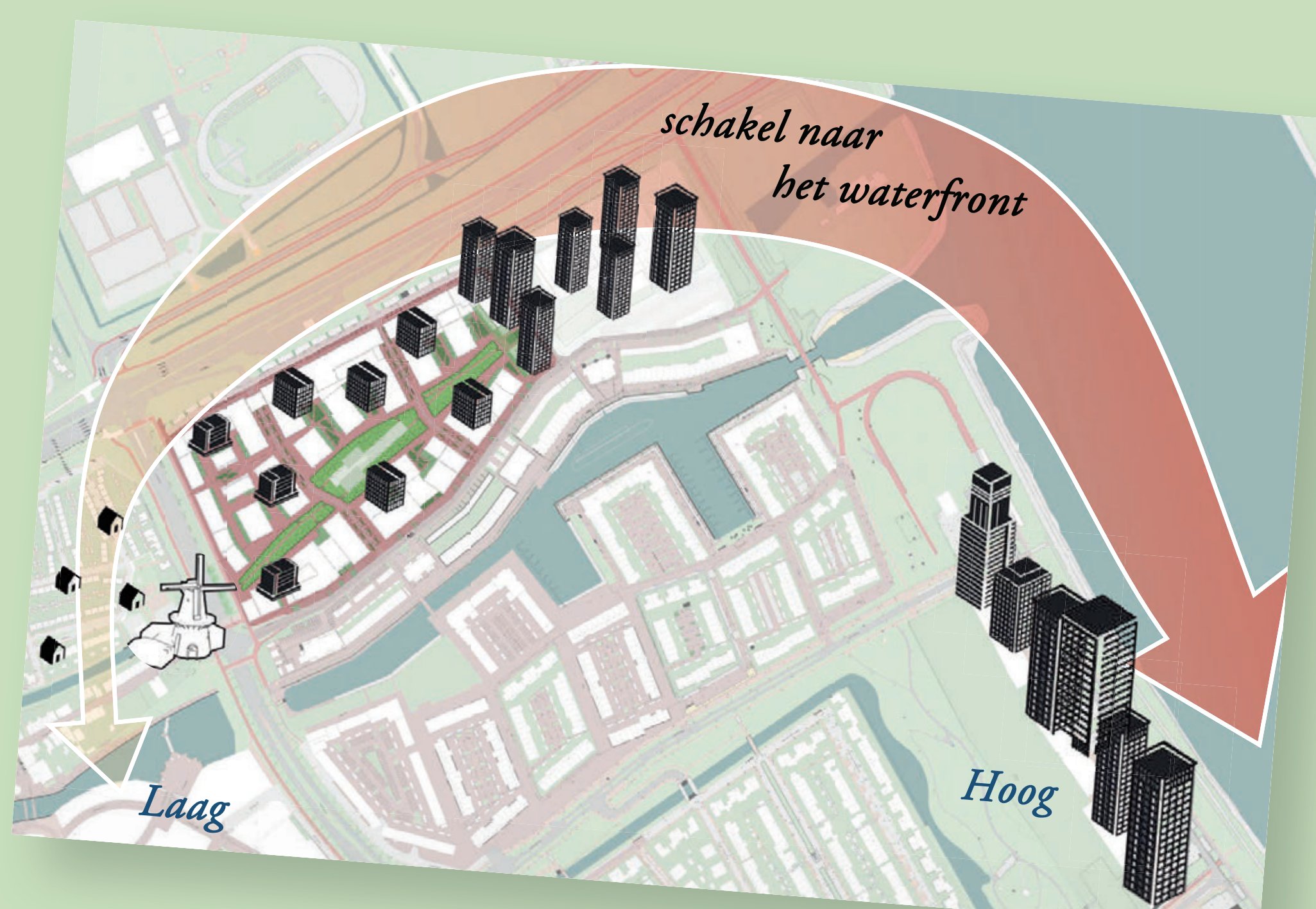
Koppelen van centrumgebied en waterfront