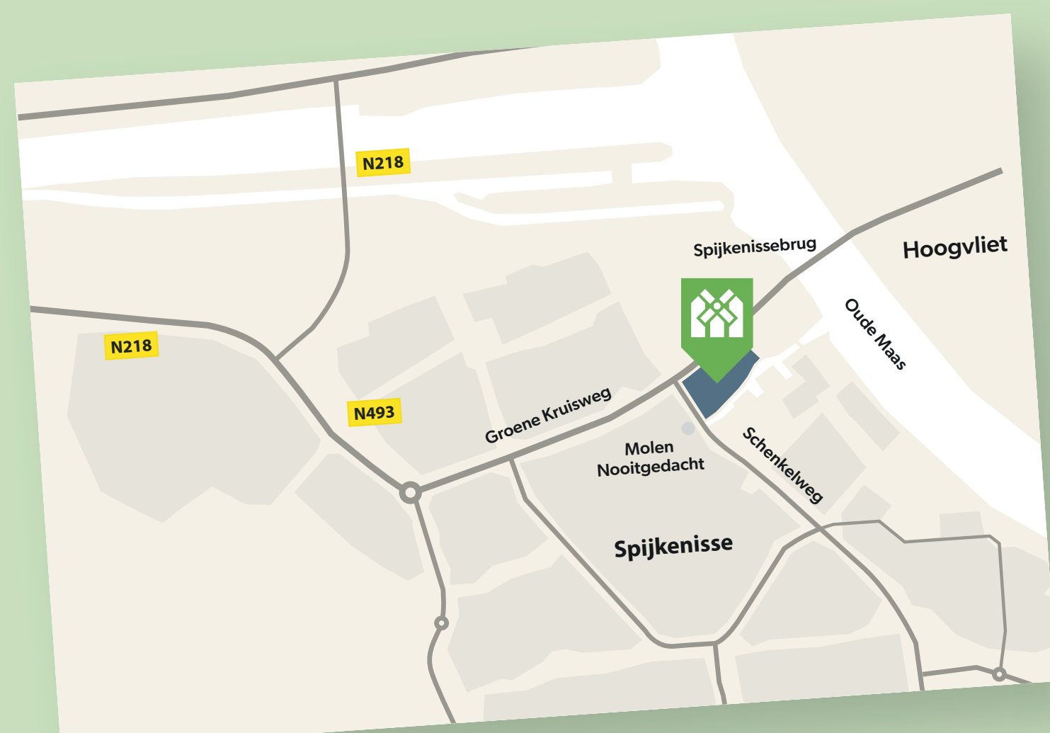
Locatie t.o.v. Spijkenisse