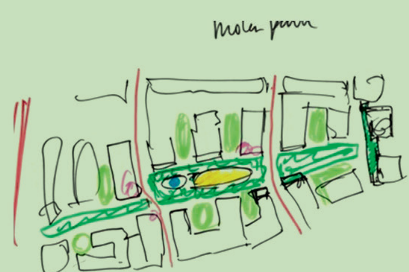
Eerste schetsen plangebied

Een wijk met een groen hart aan de molen!